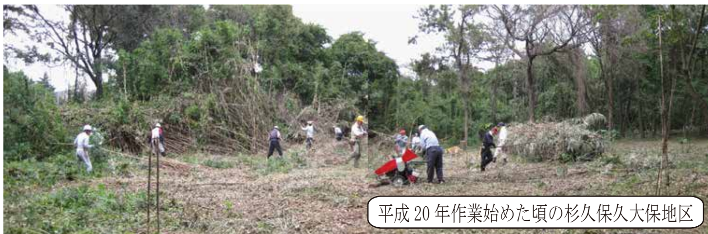
平成 20 年作業始めた頃の杉久保大久保地区

平成 20 年から作業を開始し、大きな竹藪、それに絡みつく藤蔓、大樹に寄生し栄養を吸い取る蔓を刈り、木を伐採し、下草を刈り見通しの良い森になりました。